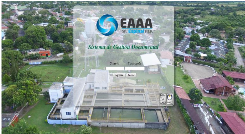
Figura 1. Ventana de Inicio SGD Orfeo

mediante solicitud realizada por el Jefe inmediato al Administrador del Sistema (Grupo de gestion documental).